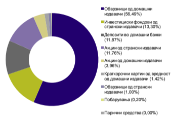
Структура на вкупните средства по држава на 31.12.2016